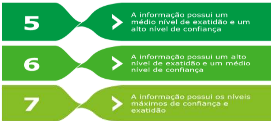
Figura 3 – Descrição das Certificações atribuíveis às informações do SNIS

Entende-se que, caso uma informação seja avaliada com o nível de confiança mínimo, esta não deve ter a sua exatidão avaliada, já que os controles internos não são capazes de gerar dados confiáveis para a execução dos testes substantivos. Assim, as informações com baixo nível de confiança são sempre certificadas com a certificação 1, conforme indicado na matriz de certificação.