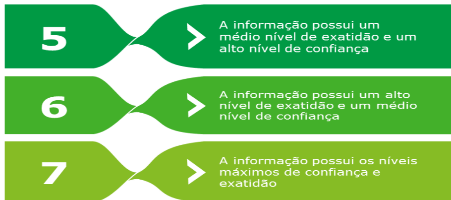
Figura 3 – Descrição das Certificações atribuíveis às informações do SNIS

Entende-se que, caso uma informação seja avaliada com o nível de confiança mínimo, esta não deve ter a sua exatidão avaliada, já que os controles internos não são capazes de gerar dados confiáveis para a execução dos testes substantivos. Assim, as informações com baixo nível de confiança são sempre certificadas com a certificação 1, conforme indicado na matriz de certificação.